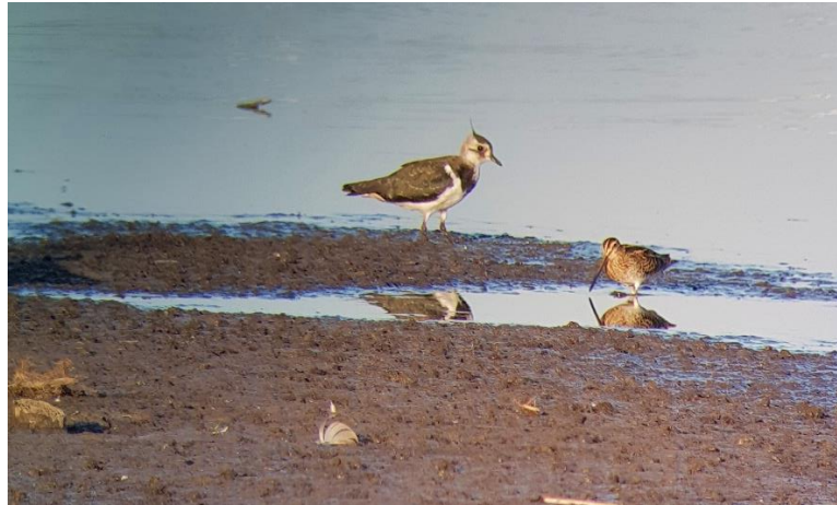
Kiebitz & Bekassine